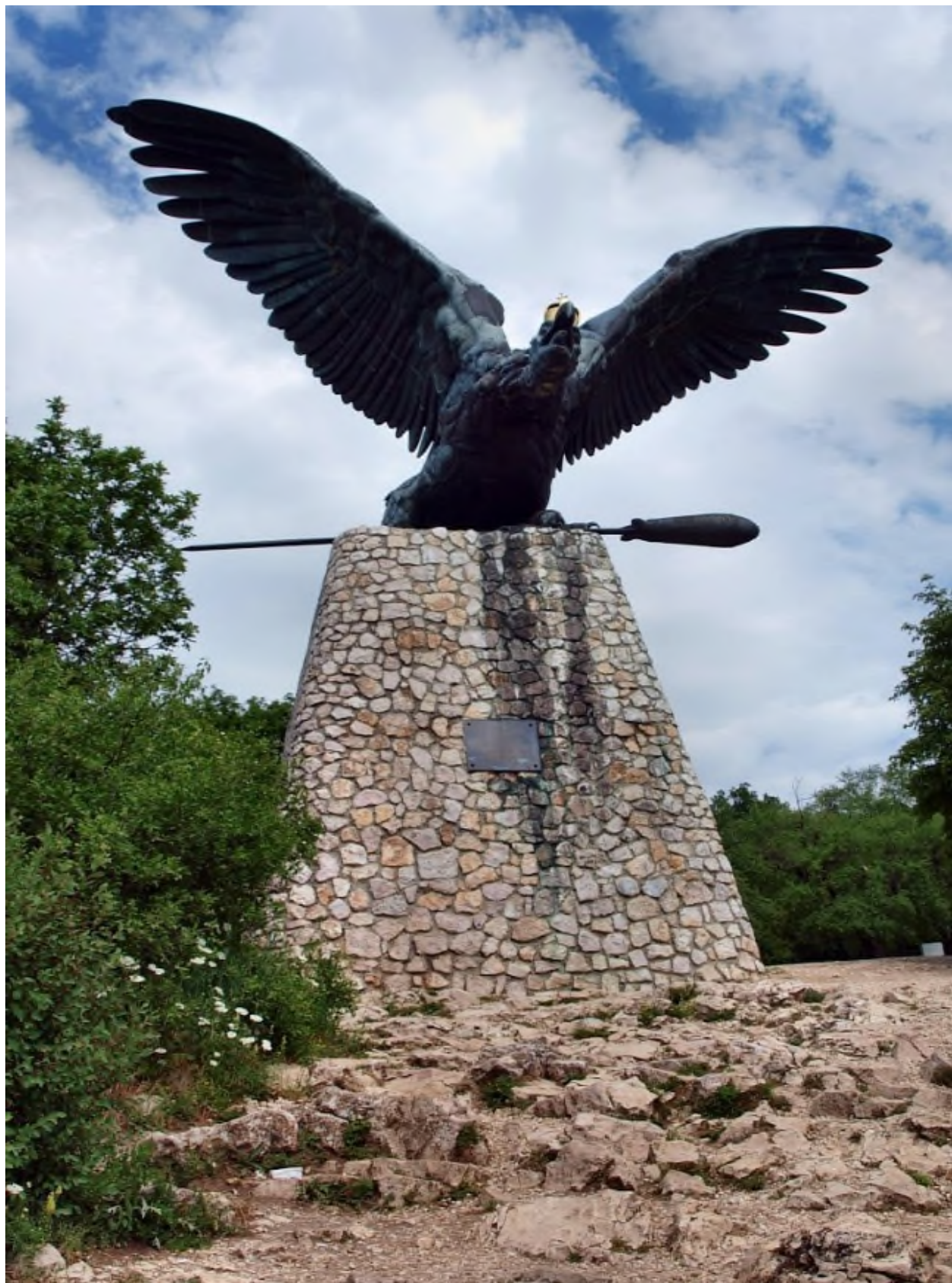
ՀԱՅԿԱՍՏԱՆԻ ԳԻՏԱԿԱՆ ԳՐԱԴԱՐԱՆԻ ԳՐԱԳՐԱԿԱՆ ԿՈՄՊԼԵՔՍԻ ԿԱՆՈՒՄԸ