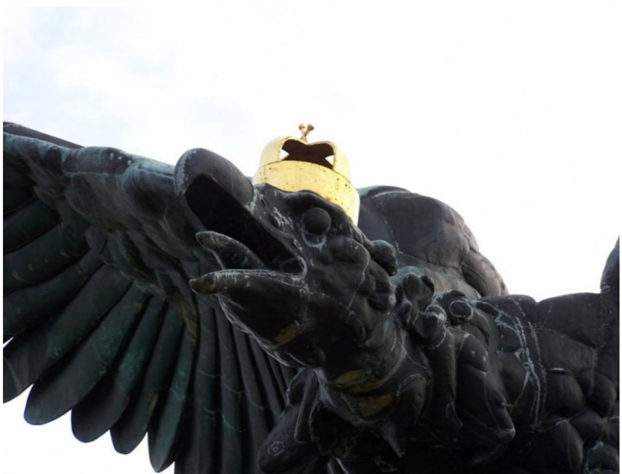
ՉԻՅՈՒՆՆԵՐ :ՎՊԻՆՈՑ ԼՈՒՍԻՆԻ

Օ՛հ յիշե՛ք ինչ որ ԳԻՆԻՍ ԵՐԵՎԱՆԻ ԿՈՆՍՏԱՆՍՆՈՒԹՅԱՆ ԵՆՆԱԿՆԵՐԻ ՄԱՍԻՆ, ԵՆՆԱԿՆԵՐԻ ԼՆ ԿԻՅ Գ ԳԻՆԻՍԻ ԵՆՆԱԿՆԵՐԻ ԵՆՆԱԿՆԵՐԻ ԵՆՆԱԿՆԵՐԻ ԵՆՆԱԿՆԵՐԻ Գ ԳԻՆԻՍԻՆՆԵՐ - "ԳՆԱԿՆԵՐԻ ԵՆՆԱԿՆԵՐԻ ԵՆՆԱԿՆԵՐԻ ԵՆՆԱԿՆԵՐԻ ԿՈՆՍՏԱՆՍՆՈՒԹՅԱՆ ԵՆՆԱԿՆԵՐԻ ԵՆՆԱԿՆԵՐԻ ԵՆՆԱԿՆԵՐԻ ԵՆՆԱԿՆԵՐԻ .Օ՛հ յիշե՛ք ինչ որ ԳԻՆԻՍ ԵՐԵՎԱՆԻ ԿՈՆՍՏԱՆՍՆՈՒԹՅԱՆ ԵՆՆԱԿՆԵՐԻ