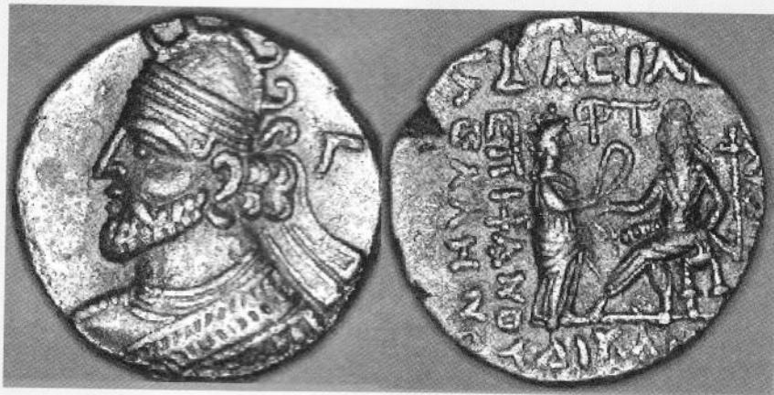
P rthus p nz rm k - Vologases II. 77-80 tetradrachma

II. Vologases 77-80 Tetradrachma, Verde: Seleucia, 77-78. El lapp: kir ly balra n z, fej n tiara „kamp kkal” d sz tve. M g tte g r g G bet . H ttlap: kir ly tr non balra  l, szemben Tyche diademet ad  t.